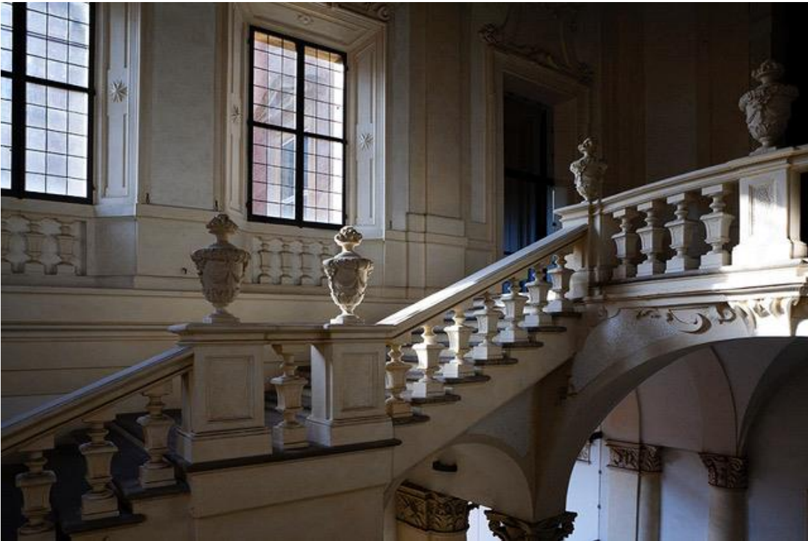
Palazzo Davia Bargellini, Strada Maggiore