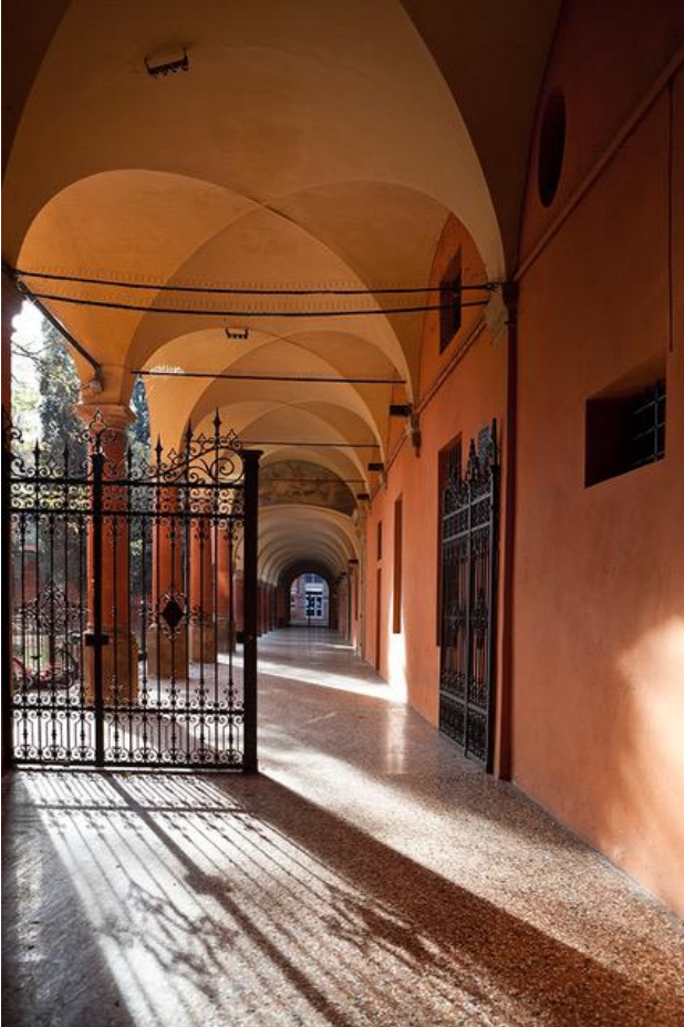
Museo della Resistenza, via Sant'Isaia