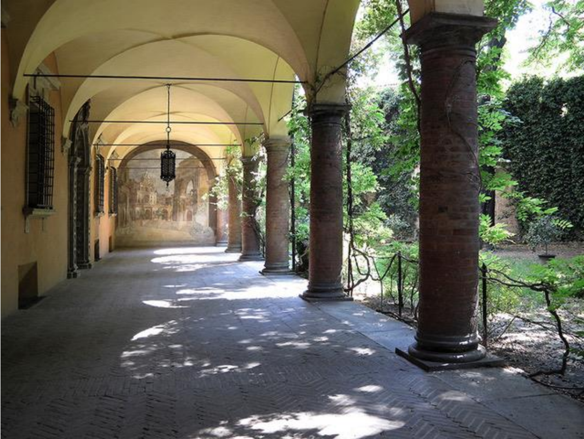
Interno Collegio di Spagna