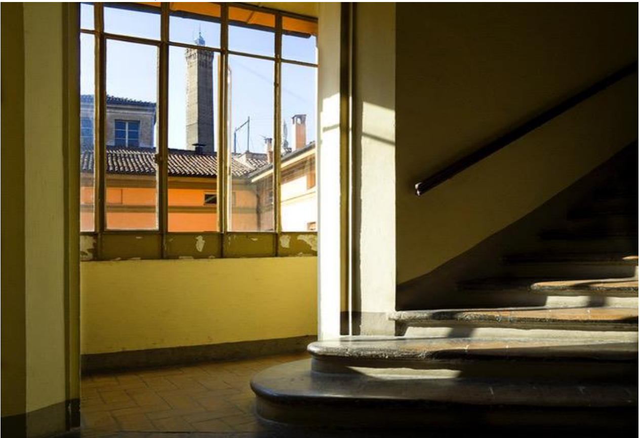
Interno Palazzo Isolani