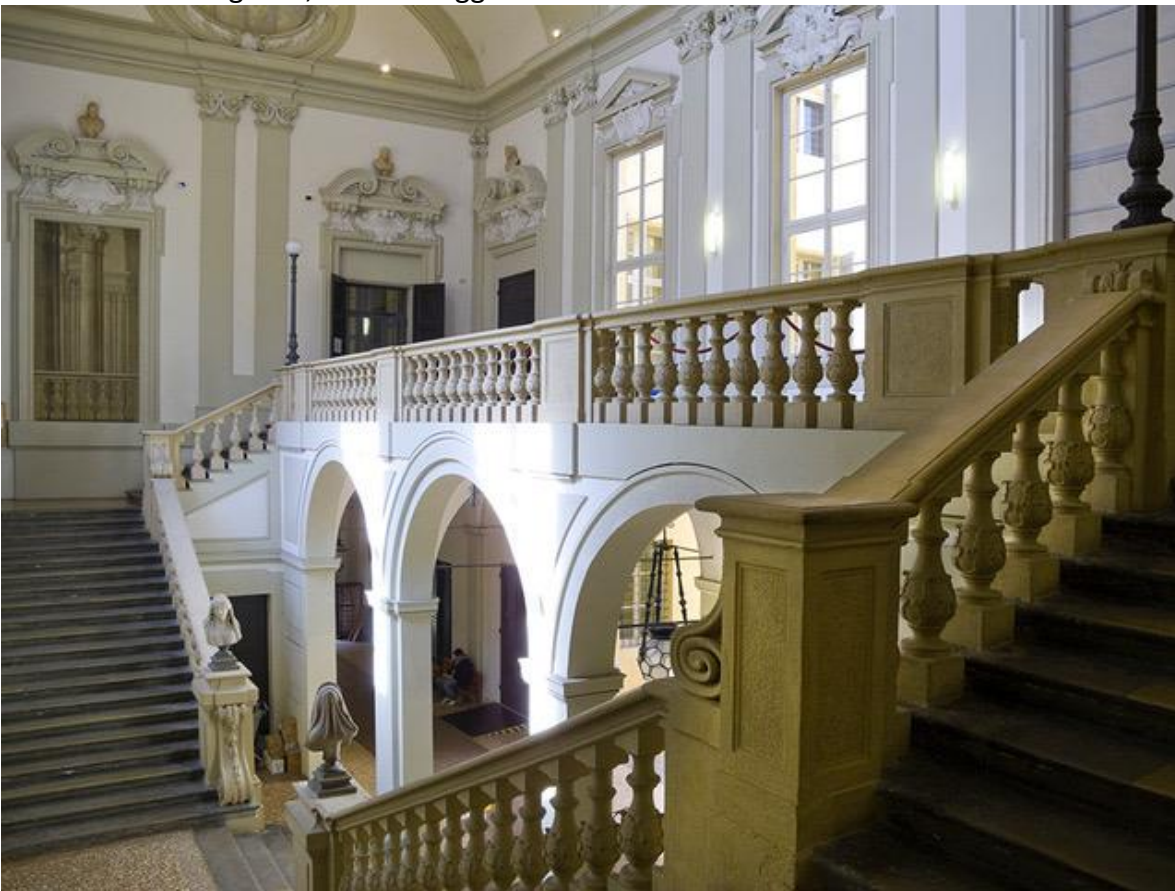
Palazzo Marescotti, Via Barberia